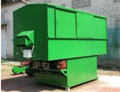
Пробоотборник зерна А1- УП- 2А (без колон и мостов) цена с НДС 1150000 руб.