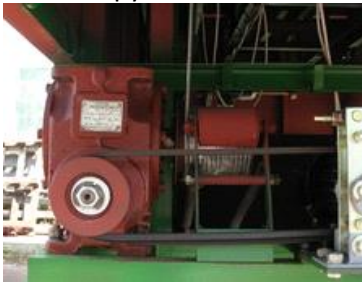
Редуктор в сборе с барабаном и шкивом цена с НДС 62102.85 руб.