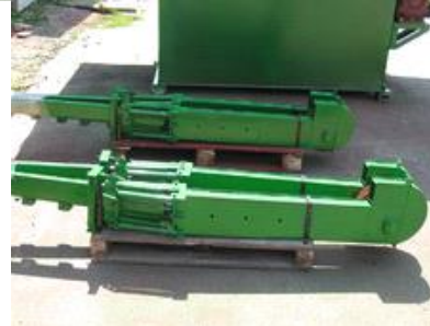
Нория в сборе со шкивом и цепочкой цена с НДС 35000 руб.