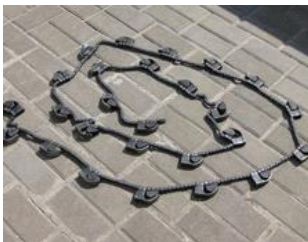
Цепь с ковшами цена с НДС 9275.72 руб.

Реконструкция пробоотборника А1-УП-2А, увеличение дорожного просвета на 500 мм, (увеличение норий на 500 мм ) - 148000 рублей с НДС 18%.